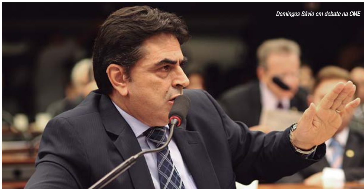
Domingos Sávio em debate na CME

Deputado Federal Domingos Sávio encabeça grandes discussões em defesa do setor