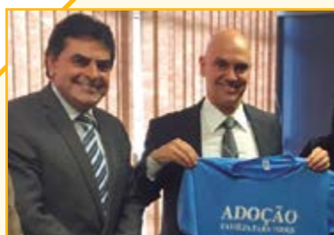
Alexandre Moraes Ministro da Justiça e Cidadania

Ministros e o próprio presidente Michel Temer para discutir assuntos de interesse que estavam sendo postergadas pelo governo do PT, além de defender grandes projetos e pediu a liberação de recursos que estavam sendo contingenciados pelo