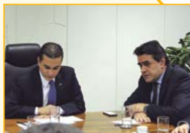
Guilherme Campos Presidente dos Correios

O deputado federal Domingos Sávio, representantes da Associação Brasileira da Indústria Têxtil e de Confecções (ABIT) e empresários do setor têxtil e de confecções reuniram-se com o Ministro da Indústria, Comércio Exterior e Serviços, Marcos Pereira para debater a necessidade de políticas públicas que fortaleçam a cadeia produtiva do setor têxtil e da indústria do vestuário. Na oportunidade, o deputado alertou sobre os riscos que este setor vem correndo com a concorrência dos produtos principalmente originários da China. Somente no setor de vestuário, identifica-se mais de 20 subsídios que são oferecidos pelo governo chinês e que colocam o produto importado da China numa condição desigual e injusta para concorrer com a produção brasileira.