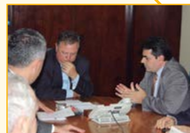
Ronaldo Nogueira Ministro do Trabalho

Deputado Domingos Sávio e demais parlamentares da Frente Parlamentar Mista da Suinocultura estiveram com o Ministro da Agricultura, Blairo Maggi, solicitando algumas medidas de apoio aos suinocultores. Dentre elas, a isenção de PIS/Cofins para importação de milho, a prorrogação dos custeios pecuários para os suinocultores e uma linha de crédito para retenção de matrizes. O ministro comprometeu-se em estudar e adotar medidas para ajudar no desenvolvimento do setor.