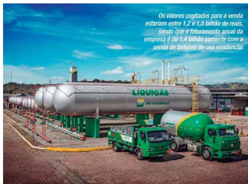
Os valores cogitados para a venda estariam entre 1,2 e 1,5 bilhão de reais, sendo que o faturamento anual da empresa é de 1,4 bilhão somente com a venda de botijões de uso residencial

possível, mais audiências públicas envolvendo os principais dirigentes da Petrobras, parlamentares, entidades trabalhistas e a sociedade, para aprofundar o debate sobre a proposta de privatização.