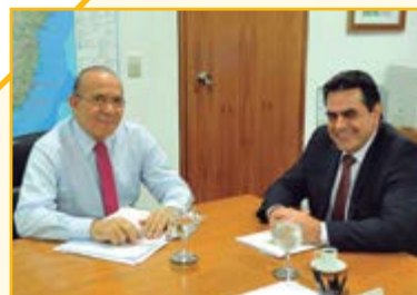
Eliseu Padilha Ministro da Casa Civil

O deputado federal Domingos Sávio se reuniu com diversos ministros de Minas Gerais. O parlamentar tucano levantou bandeiras que estão em setores econômicos importantes para Minas. Em todos os encontros, ele defendeu o governo Dilma Rousseff.