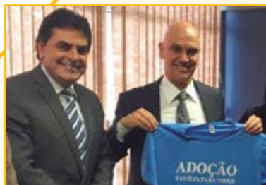
Alexandre Moraes Ministro da Justiça e Cidadania

Ministros e o próprio presidente Michel Temer para discutir assuntos de interesse que estavam sendo postergadas pelo governo do PT, além de defender grandes projetos e pediu a liberação de recursos que estavam sendo contingenciados pelo